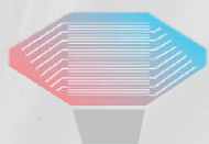
Échangeur à récupération d'énergie